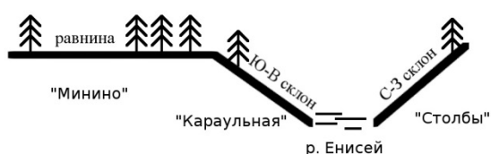
Рис. 1. Схема территорий исследования формы поперечного сечения деревьев

Природные условия района исследования. Изучение особенностей формы поперечного сечения стволов деревьев проводилось на трех территориях, различающихся между собой по типам ландшафта. Первый участок располагался на равнине и характеризовался максимальной однородностью условий произрастания насаждений («Минино»). Второй участок представлял собой юго-восточный склон, нижней точкой которого являлся уровень реки Енисей («Караульная»). Третий участок размещался на противоположном склоне (северо-западном) с выраженным горным рельефом и максимальным разнообразием условий местопроизрастания сосновых насаждений («Столбы»). На рис. 1 представлена схема территорий.